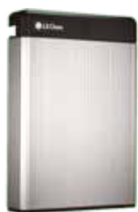
LG Chem serie RESU